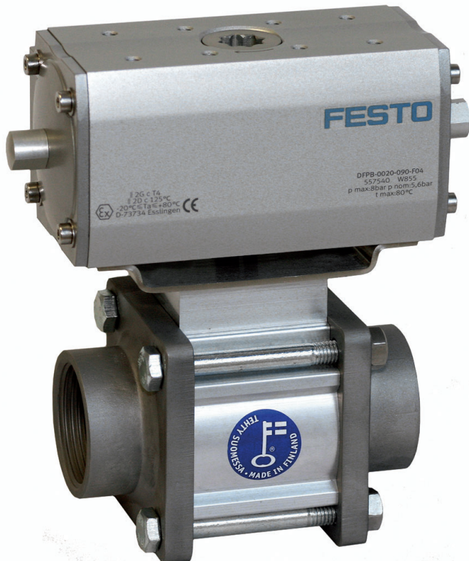
JOUKAN TOIMILAITTEVALIKOIMAAN ON LIITTYNYT MYÖS MAAILMANLUOKAN SAKSALAINEN FESTO.

lemaan tuohon pääkallopottuun. Muutaman viikon päästä ”pojat” nostettiin kuiville vahingoittumattomina. ”Ja vielä nätin näkönenkin”, totesi se asiakkaan vastahankaisin päällikkö.