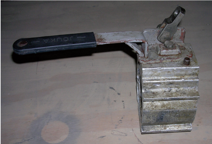
KOVISSA OLOSUHTEISSA 25 VUOTTA JA...