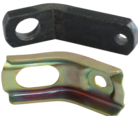
KUVASSA ALLA MUOTO, YLLÄ MURIKKA. PAINOT 170G JA 445G.

SUUNNITTELU, VALMISTUS JA MYynti: JOUKA OY, PUH. (03) 359 7500 SOMEROTIE 4, 33 470 YLÖJÄRVI WWW.JOUKA.FI, INFO@JOUKA.FI ALIHANKINTAMESSUILLA TAVATAAN SYYSKUU 21. –23. 2010. JOUKA TOIVOTTA KAIKKI NYKYISET JA TULEVAT ASIAKKAANSA TERVETULLEEKSI TAMPEREEN ALIHANKINTAMESSUILLE A-HALLIIN OSASTOLLEEN A1231.